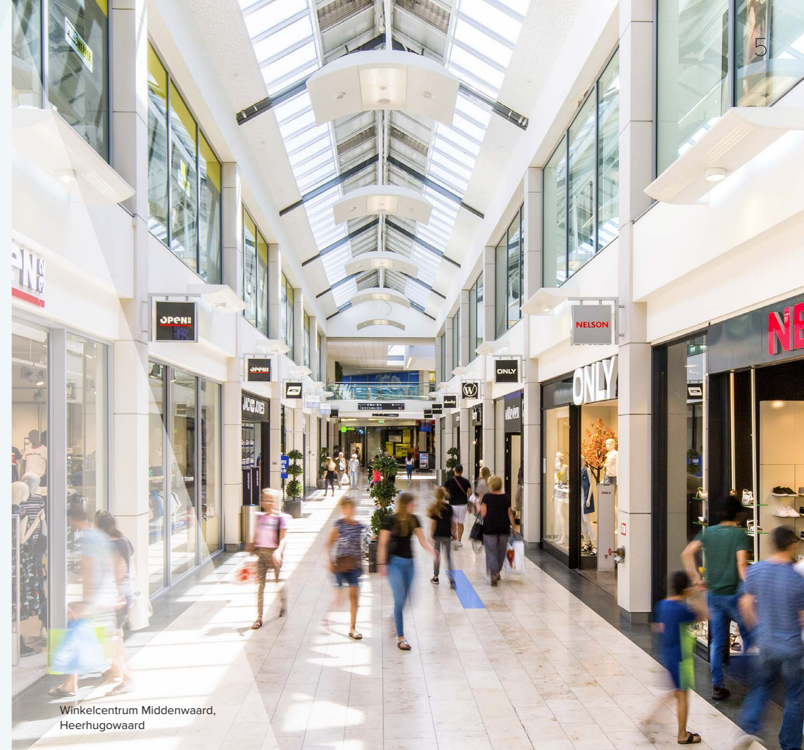
Winkelcentrum Middenwaard, Heerhugowaard

Ons team staat klaar om uw PopUp tot een succes te maken!