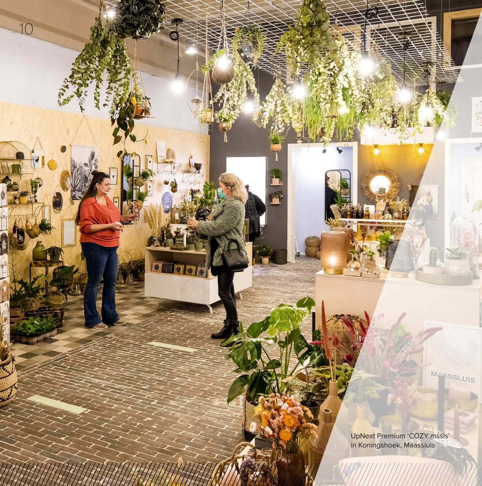
UpNext Premium 'COZY mssls' in Koningshoek, Maassluis