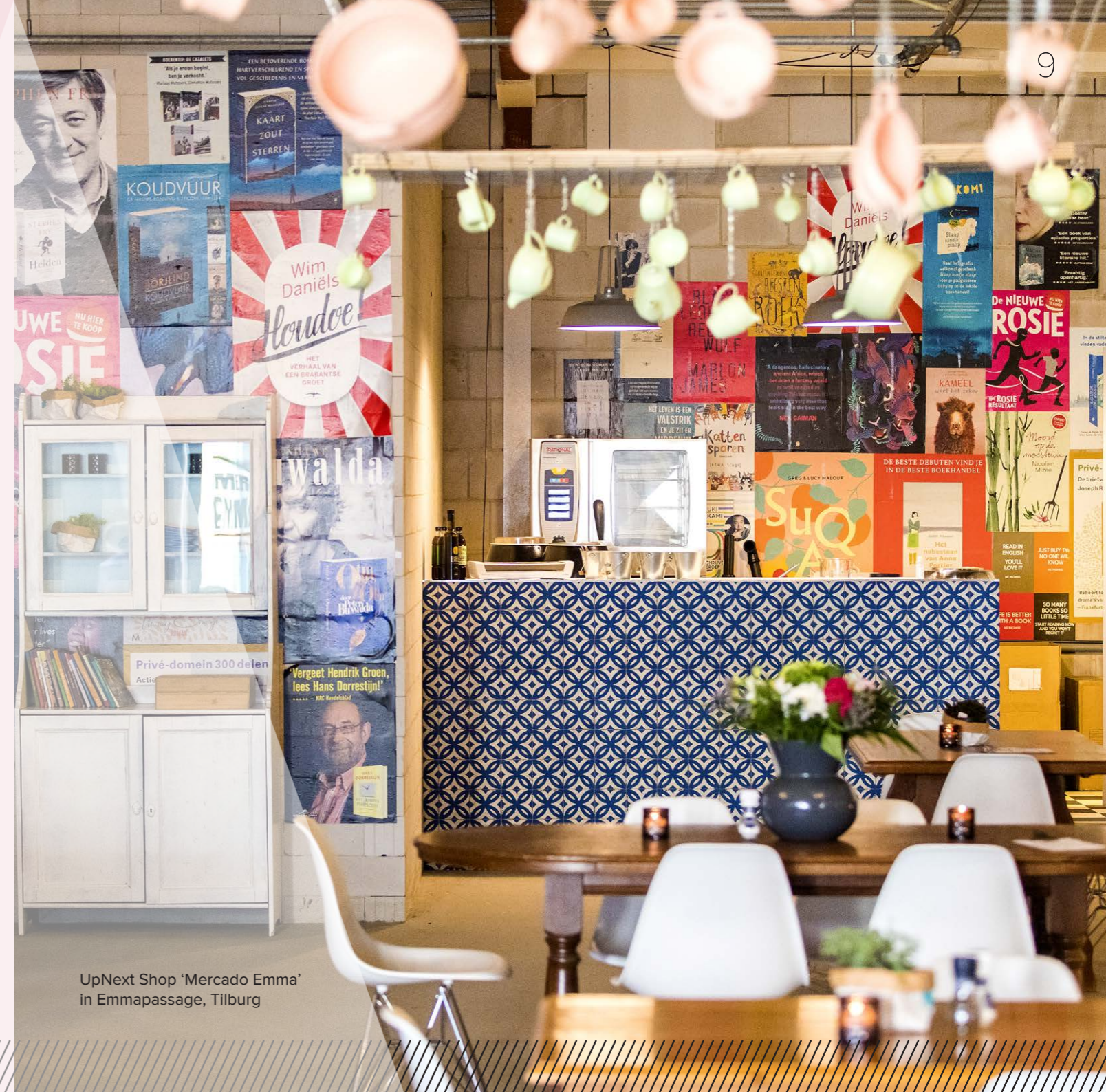
UpNext Shop 'Mercado Emma' in Emmassage, Tilburg

UpNext Shop locaties zijn direct beschikbaar in verschillende afmetingen in alle Wereldhave centers.