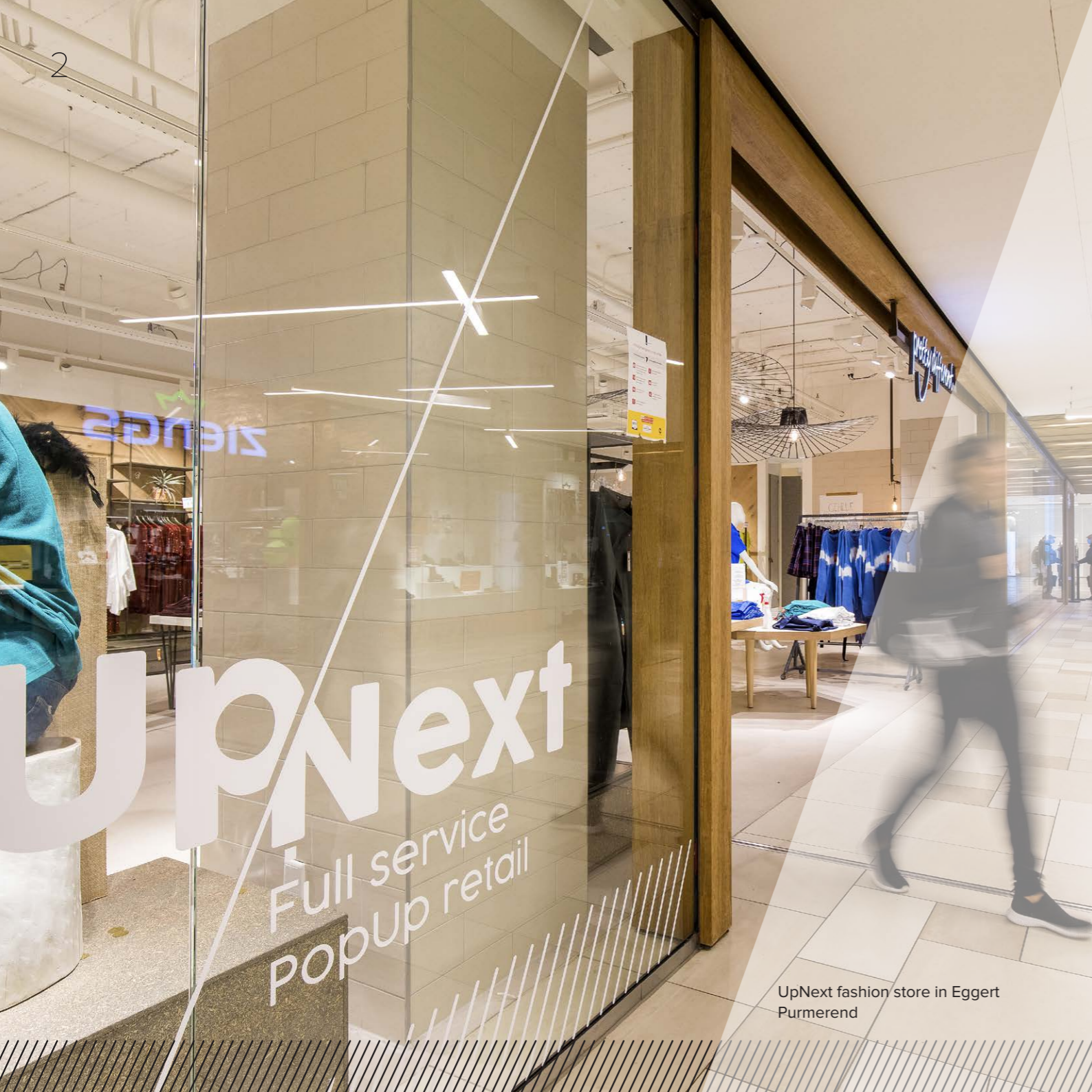
UpNext fashion store in Eggert Purmerend

‘Van een tijdelijke winkel met uw eigen inrichting en medewerkers tot een volledig verzorgde, ingerichte en bemande shop.’